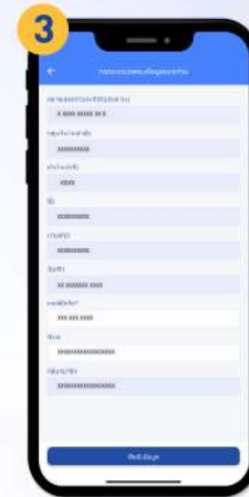
ตรวจสอบข้อมูลส่วนตัว และต้องระบุเบอร์มือถือ เพื่อรับข้อความ SMS แจ้งรหัส OTP สำหรับยืนยันตัวตน จากนั้นกด “ยืนยันข้อมูล”