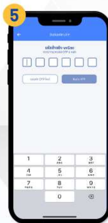
เมื่อได้รับ SMS แจ้งรหัส OTP ให้กรอกรหัสเพื่อยืนยัน OTP แล้วกด “ยืนยัน OTP” หากยังไม่ได้รับ SMS แจ้งรหัส OTP ให้กด “ขอรหัส OTP ใหม่” หรือตรวจดู ใน SMS ของมือถือ