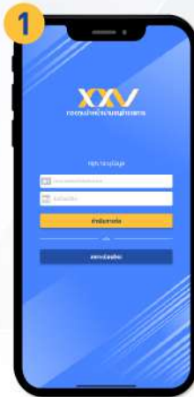
กด “ลงทะเบียนใหม่”