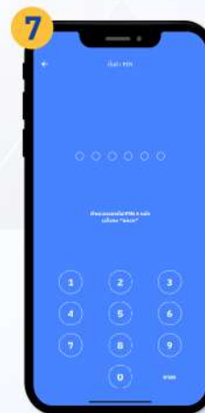
กำหนดรหัส PIN เป็นตัวเลข 6 หลัก เพื่อเข้าใช้งานแอป กบข. ในครั้งต่อไป แล้วกด “ตกลง”