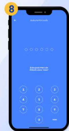
ยืนยันรหัส PIN อีกครั้ง แล้วกด “ตกลง”