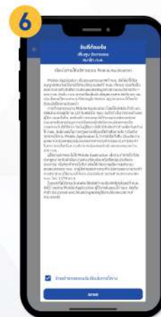
ทำความเข้าใจเงื่อนไข การใช้งานบริการฯ จากนั้นกด เพื่อยอมรับเงื่อนไข การใช้งาน แล้วกด “ตกลง”